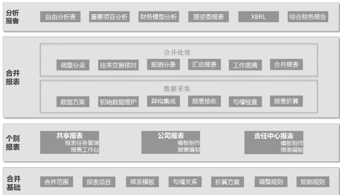
图 3 合并报表系统功能架构模型