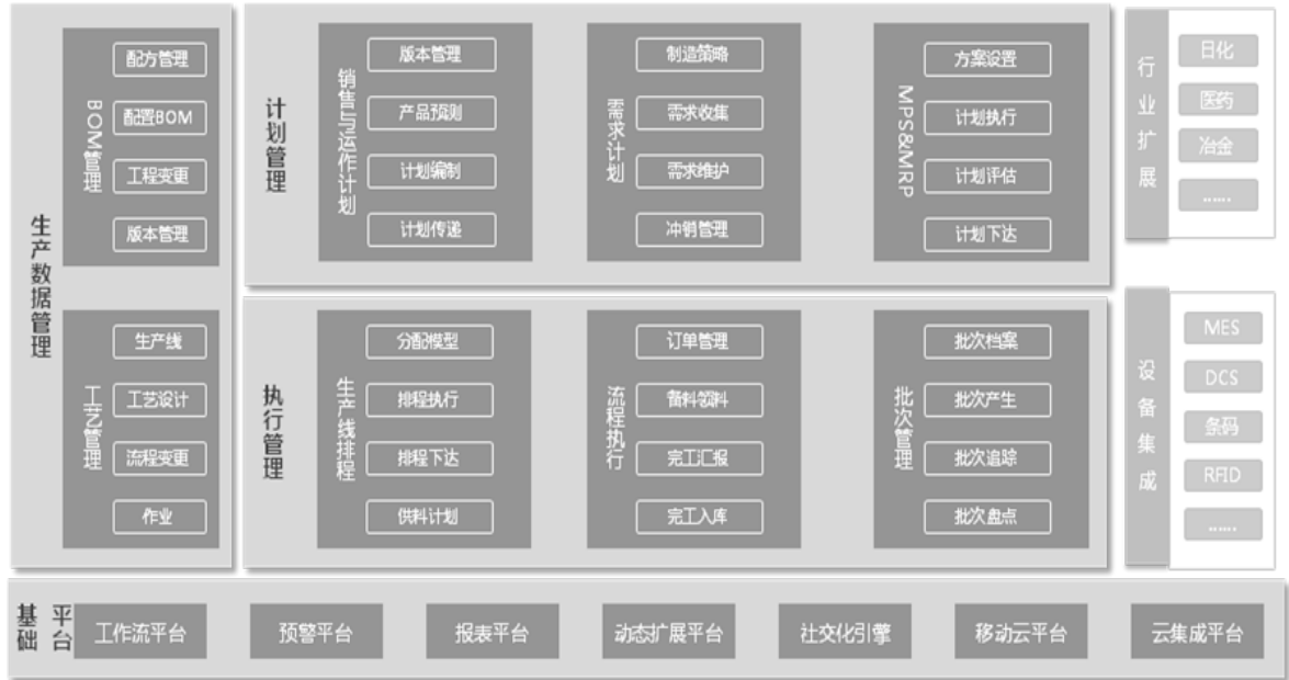
图 8 生产制造系统功能架构模型

该架构模型体现了生产制造系统的多集成性要求。可与 workflow 平台、社交化平台、云管理、移动应用平台、底层自动化执行系统、条码等多种系统集成。