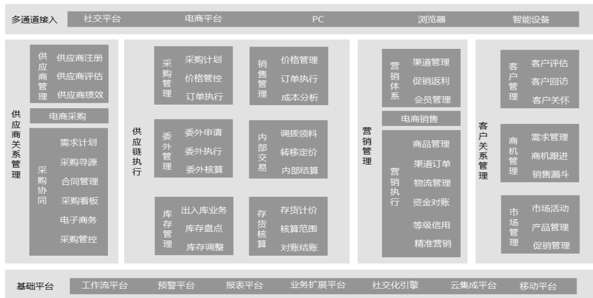
图 9 供应链管理系统功能架构模型

供应链系统也需要支持各方面的业务扩展，如：业务流程扩展、报表扩展、跨平台连接、移动化扩展等。