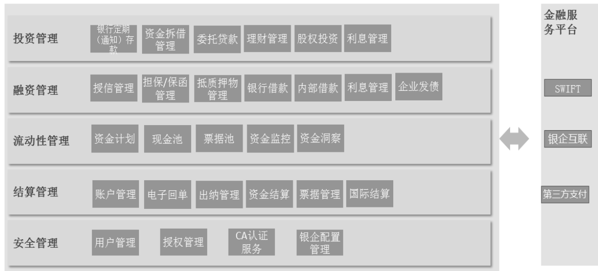
图 5 资金管理系统功能架构模型