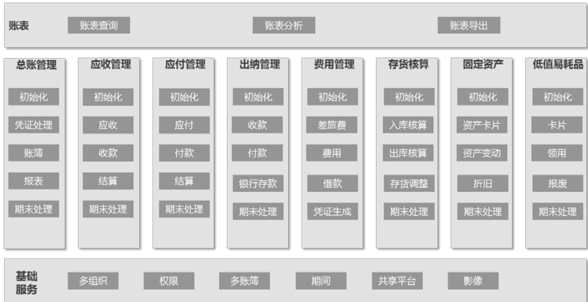
图 2 财务会计系统功能架构模型