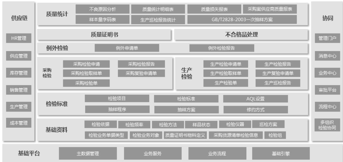
图 10 质量管理体系功能架构模型

对于集团型企业，可满足多组织，多法人单位的质量管理的委外检验，协同检验的业务需求。并可与 workflow 平台，社交化平台，云管理等多系统集成。