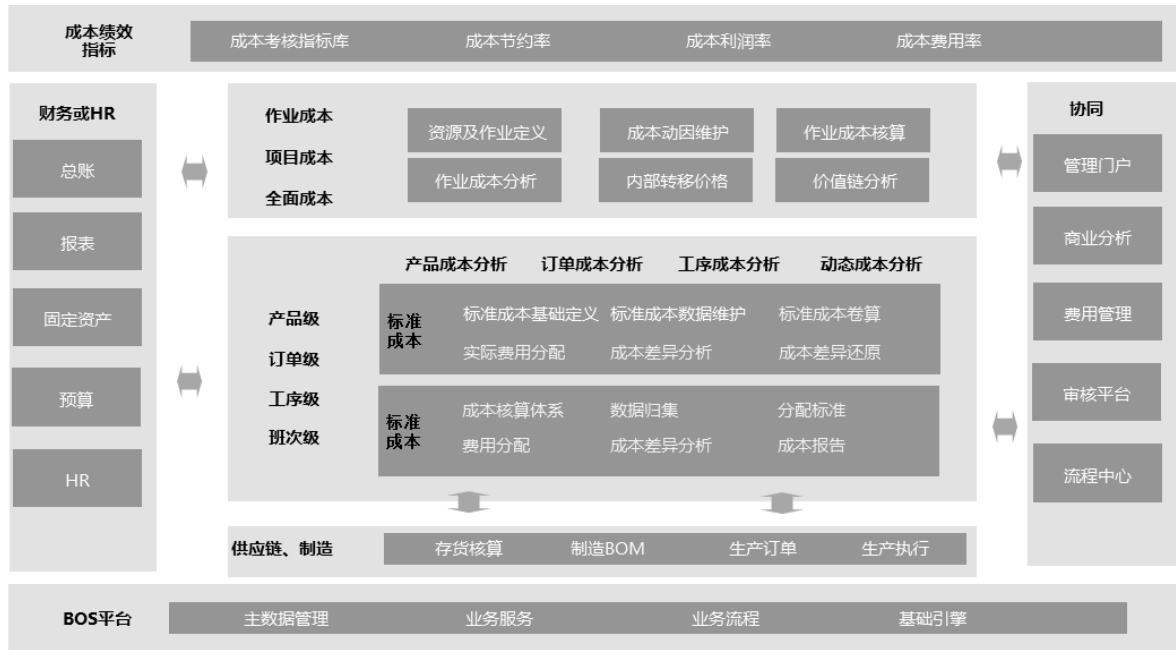
图 6 成本管理系统功能架构模型