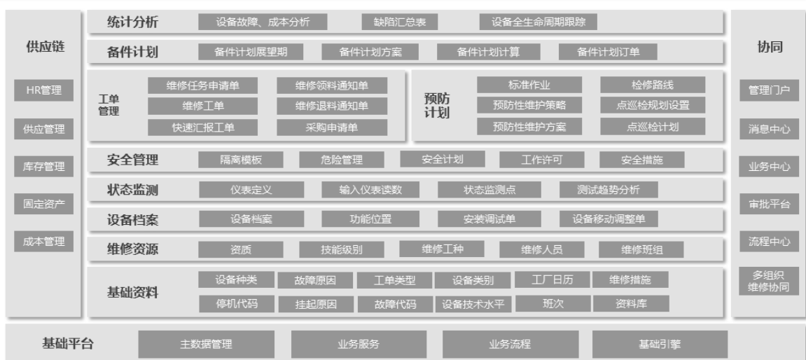
图 11 资产管理系统功能架构模型

如图 11 所示，资产管理系统，对设备的日常维护过程进行统筹计划、派工和监控。并辅以故障汇报、安全管理、点巡检、备件计划等业务，作为设备运行管理的补充。针对于集团型企业，支持企业之间设备维修业务的协同，实现“运行和检修分离”的业务模式管理。资产管理除与采购、库存、财务、固定资产、HR 等业务集成外，还可与工业控制系统等第三方系统通过接口实现集成。