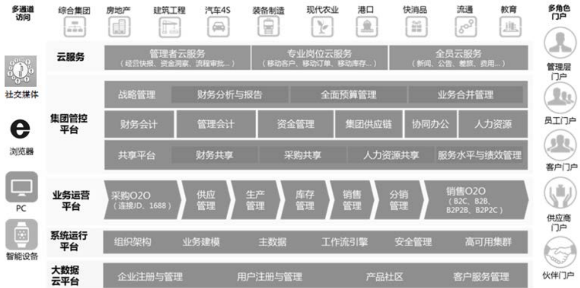
图1 集团企业经营管理信息化平台功能架构模型

根据集团企业业务特点，如图1所示，集团企业经营管理信息化平台的功能可以划分为十大业务领域：财务会计、合并报表、预算管理、资金管理、成本管理、人力资源管理、生产制造、供应链管理、质量管理、资产管理。